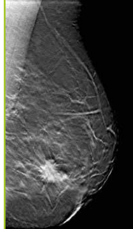
MAMMOGRAFO CON TOMOSINTESI (RISOLUZIONE PIÙ ALTA)